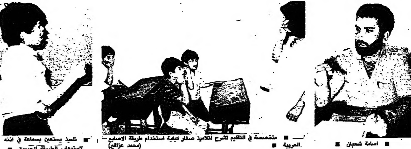
تلميذ يستعمل طريقة الاصابع العربية في التعليم لتشرح التلميذ صفة كيفية استخدام طريقة الاصابع العربية